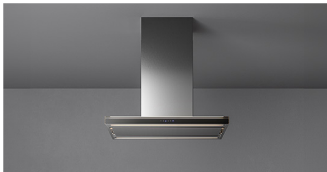
Снимката е само за информация Може да не отговаря на избрания модел